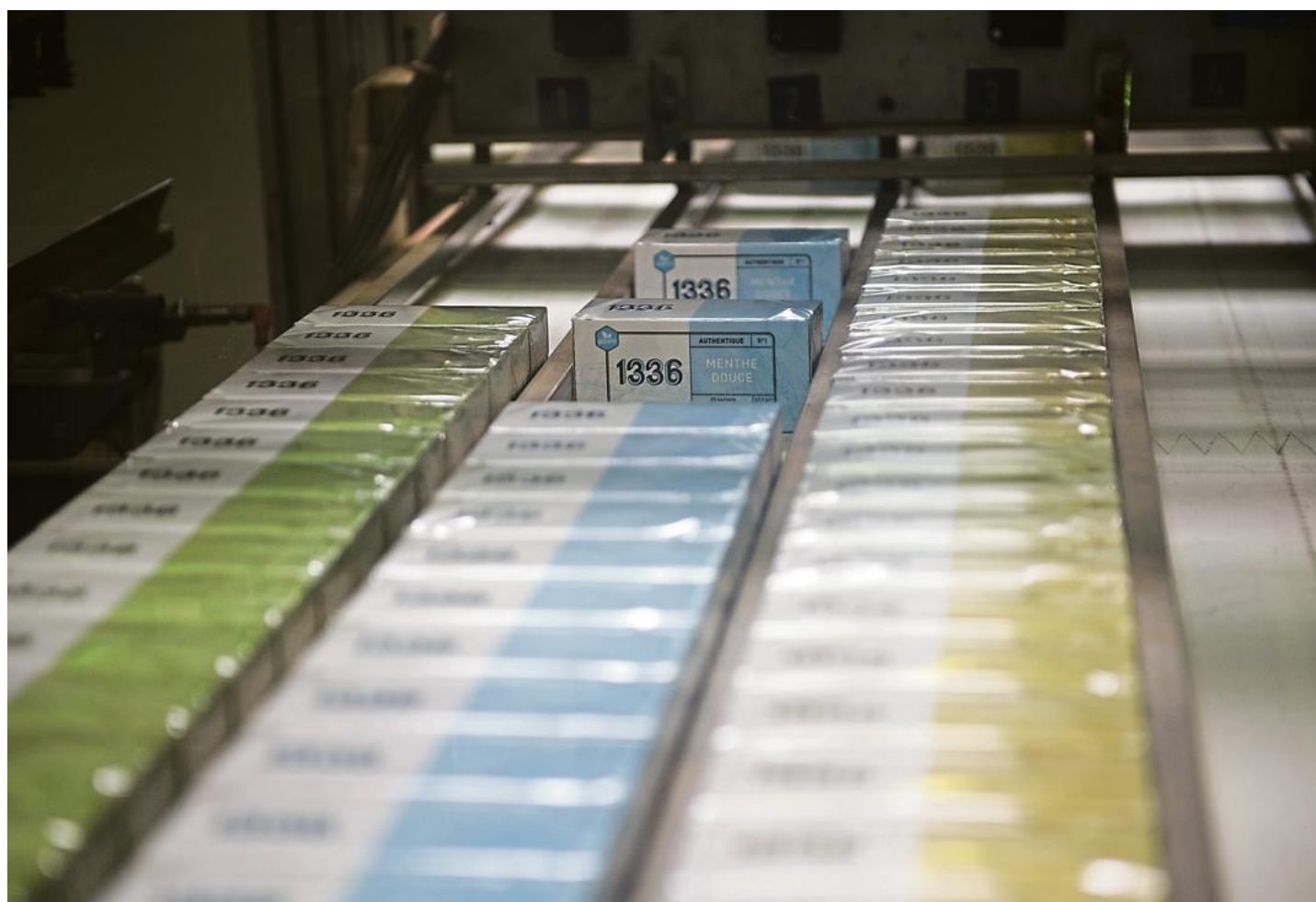
Décisions collégiales, fonctionnement transparent, écarts faibles entre les salaires les plus bas et les plus hauts... les SCOP s'inscrivent dans l'air du temps. Ici, en 2015, à Gémenos, chez 'Scop Ti', coopérative de thé, issue de la reprise de Fralib.

Des prises de décision collégiales, un fonctionnement transparent, des écarts faibles entre les salaires les plus bas et les plus hauts, les SCOP s'inscrivent dans l'air du temps. « Les femmes sont majoritaires dans notre conseil d'administration et elles représentent un quart des dirigeants de SCOP au niveau national. Dans nos recrutements, nous sommes sensibles à l'égalité des chances, nous regardons moins les diplômes que la personne que nous nous apprêtons à recruter. Quant à