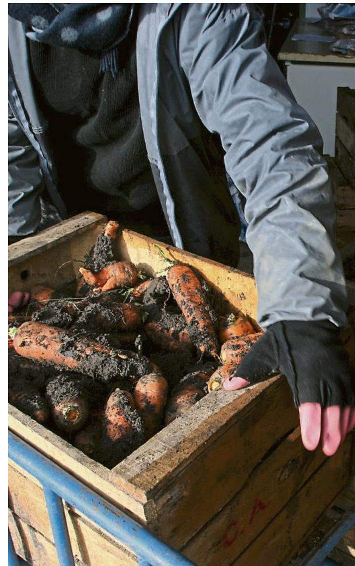
Le Biau Jardin, entreprise d'insertion, production de produits issus de l'agriculture biologique.