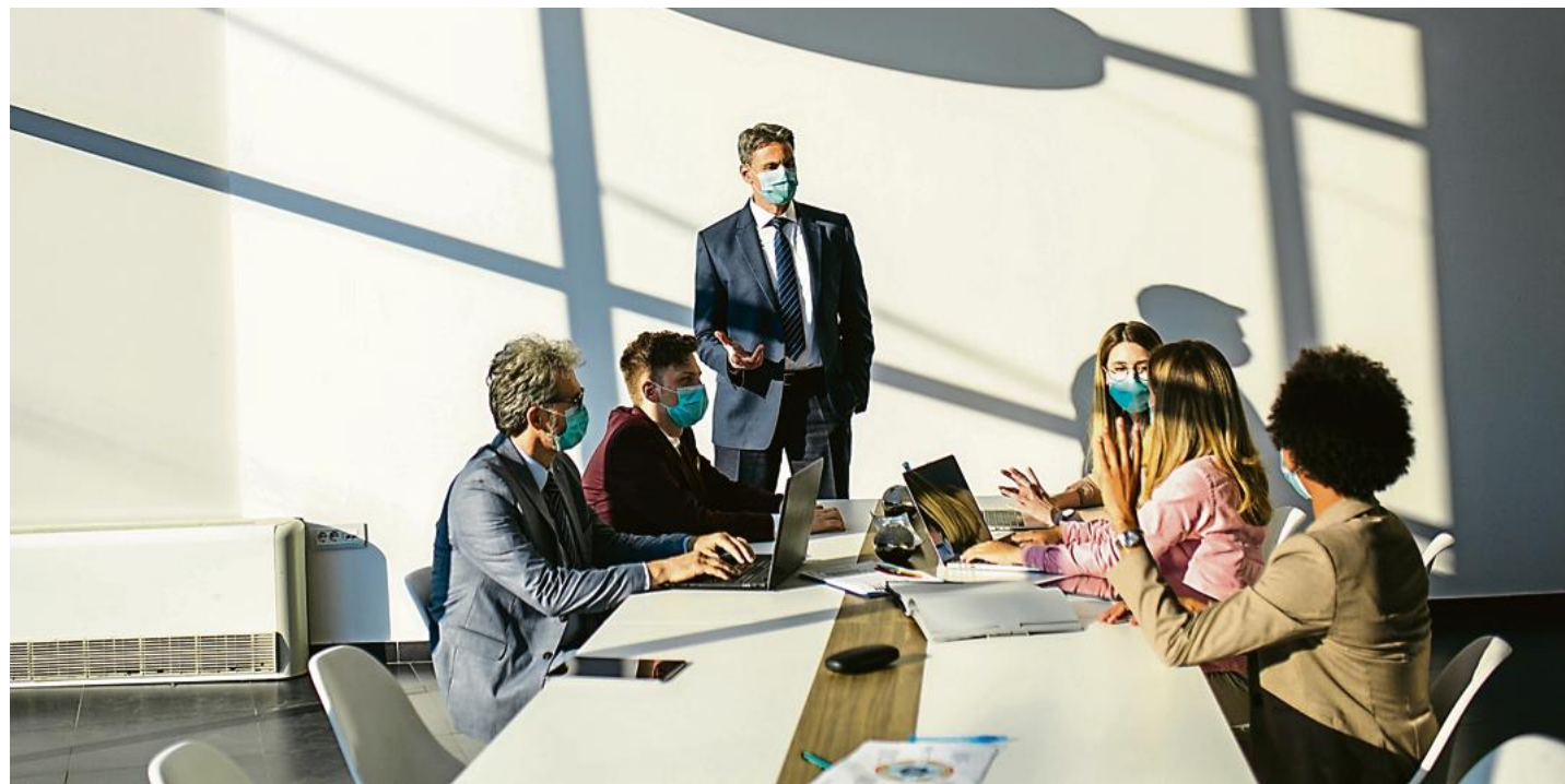
La prise de participation des membres des équipes aux décisions semble aussi être perçue comme un moyen d'améliorer l'ambiance au travail selon un sondage OpinionWay pour « Les Echos » et la CG Scop, réalisé en ligne les 7 et 8 octobre derniers.

« Le partage des décisions stratégiques entre l'entreprise et les collaborateurs est vu comme un rassemblement d'énergie au bénéfice de l'organisation », analyse le sociologue Ronan Chastellier. « Au-delà des vieilles théories de ressources humaines, ce qui concourt le plus à la compétitivité, c'est l'engagement dans un projet, ajoute-t-il. Et, dans ce cas-là, il s'agit d'une forme d'auto-intéressement éclairé du salarié ». La prise de participation des membres des équipes aux décisions semble aussi être perçue comme un moyen d'améliorer l'ambiance au travail (pour 79% des