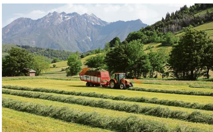
100 % des bénéfices servent à développer la SCIC et donc, par ricochet, son territoire en termes de création d'emplois.

Cette société coopérative d'intérêt collectif (SCIC) regroupe 75 producteurs-transformateurs et emploie 15 collaborateurs. Mangez Bio Isère valorise les productions locales et développe le bio.