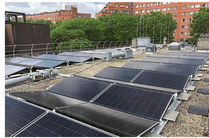
Association au départ, Enercitif est devenue une coopérative citoyenne.